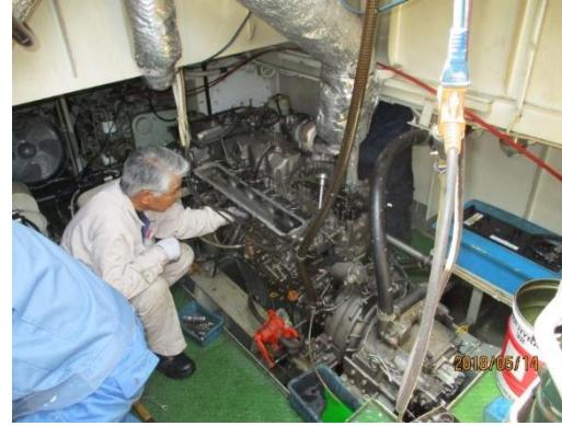
『主機関オーバーホール』