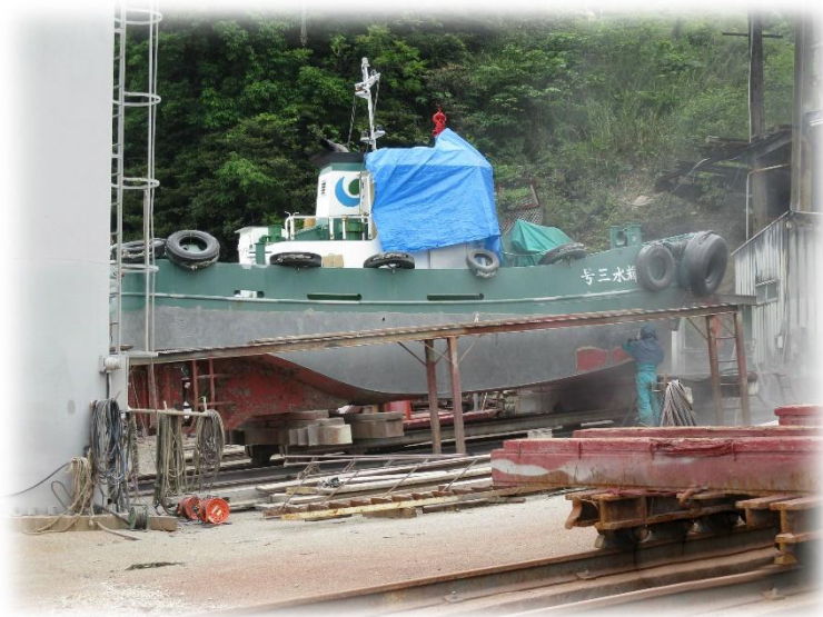
『サンドブラスト施工』